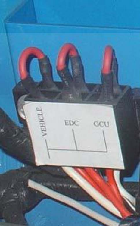
فیوز اصلی موتور دیزل

GCU : فیوز مربوط به قطعه پیش گرم کن سیلندر ها